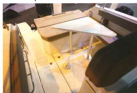
Pour sa part, 5 à 6 invités peuvent s'installer dans le salon arrière qui offre des banquettes escamotables.