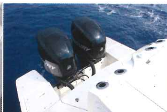
Les plateformes de poupes présentent un double accès depuis le cockpit.