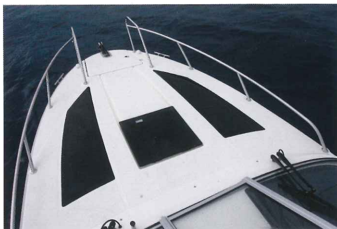
Le pont avant de l'Activ 805 Cruiser se voit bien ceinturé par des balcons et présente de belles surfaces vitrées qui apportent de la clarté dans la cabine.

même d'une assise relevable. Enfin, pour grimper sur le pont avant, il faut emprunter trois grandes marches moulées à la porte de cabine coulissante. Après avoir traversé le pare-brise qui s'ouvre par le milieu, on débouche sur un pont doté de belles surfaces vitrées, attention donc à ne pas glisser pour rejoindre la grande baïe à mouillage. En contrebas, le navire renferme un habitacle chaleureux avec une hauteur sous barrots de 1,45 m à l'entrée. La luminosité est bonne grâce aux hublots placés sur le pont avant et aux longs panneaux de coque. Installé en biais, un lit double occupe la pointe