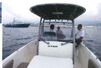
La console centrale dégage des passages symétriques de 0,36 m de large.