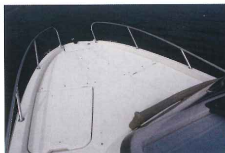
Ici dépourvue de sa sellerie, la surface de bronzage avant (2,00 x 1,70 m) intègre des dossiers inclinables.

1,65 m, ce qui s'avère plutôt correct. En face, un carré en U pour 5 personnes constitue un agréable salon d'intérieur. La clarté ambiante y est convenable grâce aux longs panneaux de coque. Cependant, remarquez qu'il n'y a pas de hublot zénithal comme sur le Cruiser. Enfin, ce salon peut aisément se moduler en couchage double de 1,80 x 1,70 m, voilà qui sera très confortable. Enfin, une salle d'eau, elle aussi identique à celle du Cruiser trouve sa place à tribord. Néanmoins sa hauteur sous barrots de 1,43 m sera d'autant plus appréciable. En dernier lieu, une mid-cabin dont l'intimité sera préservée par un rideau coulissant dévoile un lit double de 1,90 x 1,40 m et une hauteur sous plafond de seulement 0,58 m, car rappelons-le, cet endroit est situé sous le cockpit. ■