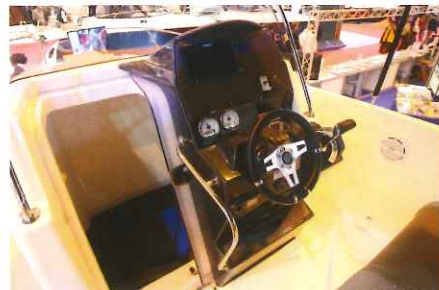
La console présente un superbe poste de pilotage ainsi qu'une porte coulissante menant à la cabine.