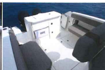
... qui permettent de moduler en un clin d'oeil la configuration du cockpit.