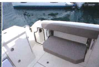
Les hauts pavois de 0,83 m intègrent des banquettes doubles déployables...