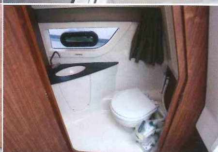
Avec ses 1,43 m de hauteur sous barrots et sa large porte, le cabinet de toilette se montre fonctionnel.