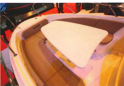
Le salon de pointe sera idéal pour partager un apéritif à 6 personnes grâce à sa banquette en V.