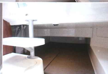
Situé sous le cockpit, le couchage arrière offre des dimensions de 1,90 x 1,40 m et une hauteur de 0,58 m.