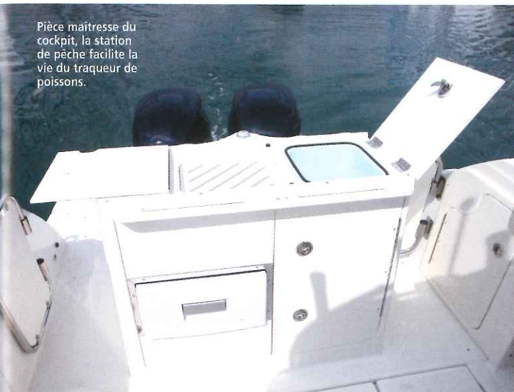
Pièce maîtresse du cockpit, la station de pêche facilite la vie du traqueur de poissons.