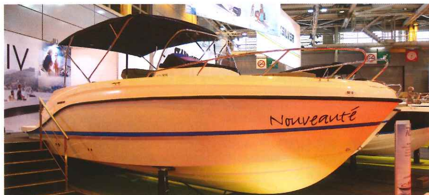
L'Activ 805 Open était notamment à découvrir au Nautic de Paris sur le stand Quicksilver.