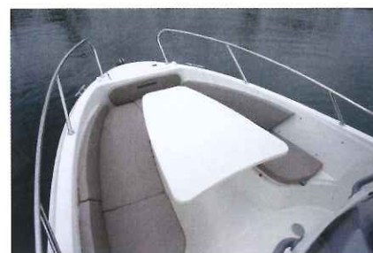
Destiné à recevoir 5 à 6 invités, le salon de pointe se révèle convivial et plutôt sécurisant.