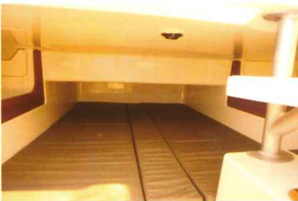
En contrebas, un couchage de 1,90 x 1,40 m et une hauteur de 0,57 m permettent de passer une nuit.