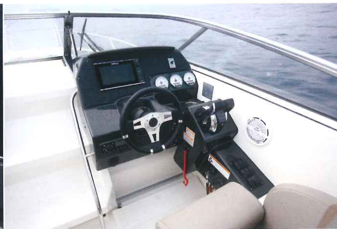
Le poste de pilotage se montre très protecteur et plutôt ergonomique avec des emplacements dédiés pour les manette de gaz et l'électronique.