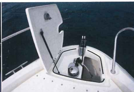
La baille à mouillage dispose d'une belle trappe d'ouverture montée sur vérin, c'est pratique !