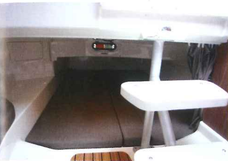
Derrière la descente, la mid-cabin met à disposition un couchage double de 1,90 x 1,40 m.