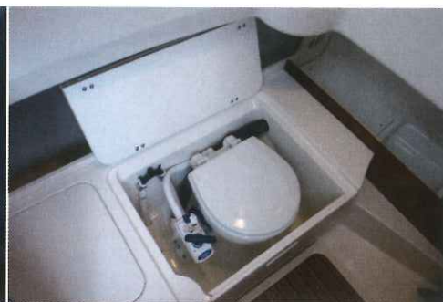
La trappe tribord renferme pour sa part un emplacement pour wc marins, c'est toujours appréciable.