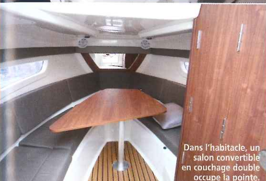
Dans l'habitacle, un salon convertible en couchage double occupe la pointe.