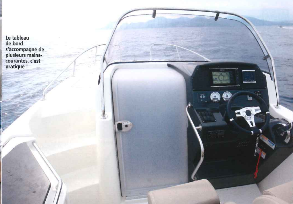
Le tableau de bord s'accompagne de plusieurs mains-courantes, c'est pratique !