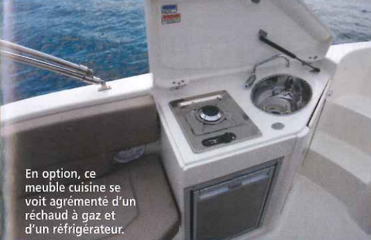
En option, ce meuble cuisine se voit agrémenté d'un réchaud à gaz et d'un réfrigérateur.