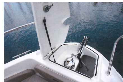
La baïlle à mouillage s'avère très pratique d'accès avec sa grande trappe et son vérin.

ce bateau est vraiment capable d'embarquer tout le matériel adéquat pour la pêche. Ce n'est pas le cas de tous ses concurrents sur le marché. Implantée en position centrale, la console de pilotage est ceinturée par des passavants symétriques (0,36 m) menant à un sympathique salon de pointe. Cinq à six personnes peuvent s'installer confortablement autour de la grande table amovible et chaque extrémité arrière de la banquette est inclinable afin de former une agréable méridienne pour s'allonger face à la route. Voilà un équipement qui séduira de nombreuses personnes. Enfin, bien évidemment, l'ensemble se montre convertible en bain de soleil de 1,70 x 1,50 m. Pendant que certains pêchent dans le cockpit arrière, d'autres pourront ainsi profiter du farniente depuis le pont avant. Pour conclure, passons dans l'habitacle qui se révèle très surprenant pour un open. En effet, alors que nous sommes habitués à découvrir un vaste abri de console sur des bateaux de cette catégorie, l'Activ 805 Pro Fish cache bien son jeu car il renferme non seulement un beau volume de rangement dans la partie avant de la console, ainsi que des wc mais surtout un véritable couchage double (1,90 x 1,40 m) logé sous le cockpit.