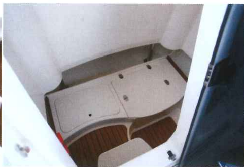
Au pieds de la descente, la hauteur sous barrots atteint 1,62 m et des rangements sont disponibles.