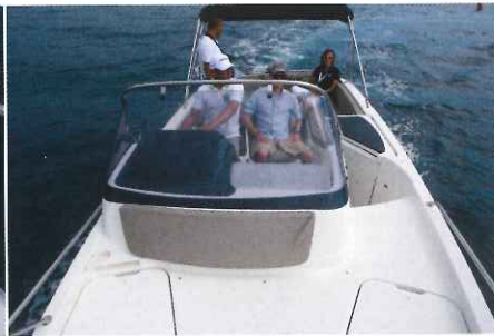
Déporté sur tribord, le poste de pilotage laisse un large passavant avec marches pour l'accès à la pointe.