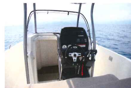
Le poste de pilotage se montre très ergonomique et s'accompagne de plusieurs mains-courantes.

Certes, la hauteur sous plafond s'avère limitée (0,58 m) mais il s'agit d'un véritable lit double avec de dimensions de 1,90 x 1,40 m. Bien joué Quicksilver ! ■